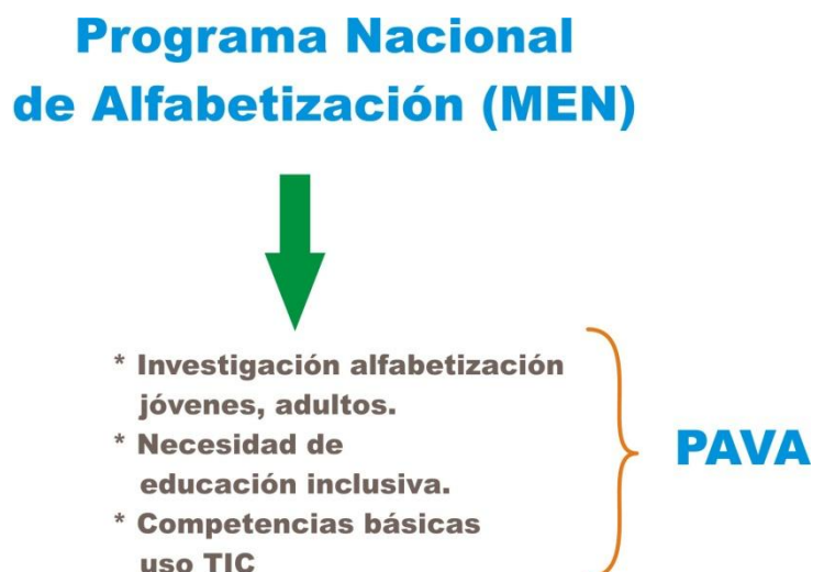
Gráfica 2. Articulación del Programa Nacional de Alfabetización con el PAVA.

Con base en lo anterior, el Programa Nacional de Alfabetización se constituye en el marco contextual y legal que enmarca y justifica el diseño, ejecución y evaluación del Programa Alfabetización Virtual Asistida, PAVA, (Gráfica 2) en la Católica del Norte Fundación Universitaria mediante el Cibercolegio UCN [4]. Por otra parte, coincidió también con la preocupación de un grupo de pedagogos quienes luego de analizar los resultados de una investigación hallaron que el país carecía de una propuesta de alfabetización para jóvenes y adultos que al tiempo los acercaran a los usos apropiados de las nuevas tecnologías de información y comunicación, TIC.